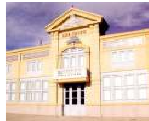
El cine EDEN hoy

La muestra, inusitada en el panorama expositivo de la fotografía, incluye fondos de coleccionistas privados y de la familia Lumière, así como de instituciones públicas, entre las que se encuentran la Sociedad Francesa de Fotografía, la Biblioteca Robert Lynen de París y el Museo Niépce de Chalon-sur-Saône.