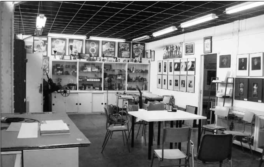
Vista parcial local social

Si algun soci vol aportar el seu temps o cedir fotografies d'exposicions, activitats, trobades, portaveus, etc.. que cregui pertinent i que siguin pròpies de Foto-Film agrairíem que es posessin en contacte amb secretaria@fotofilmcalella.org . Qual-sevol tipus de col·laboració serà benvinguda