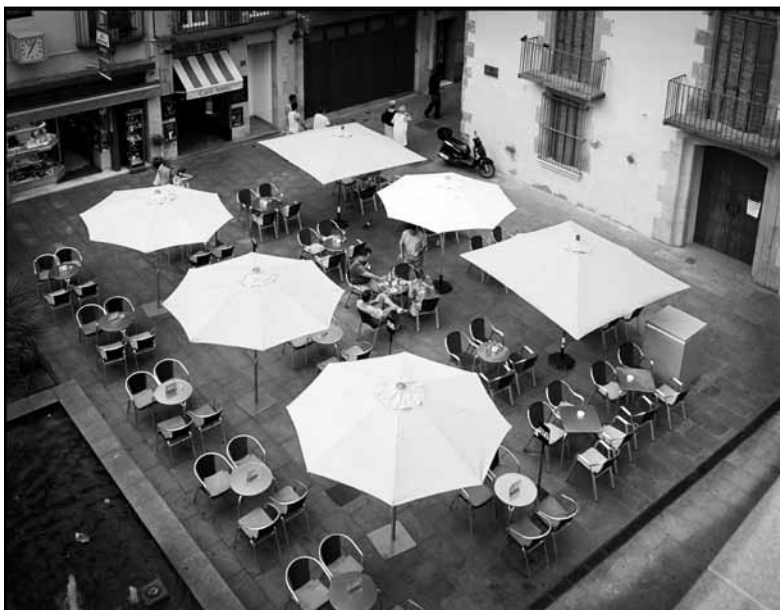
Foto guanyadora del XXII Trofeu Carpinell de Fotografia tema Calella Autor: Joaquim Sitjà (original en color)