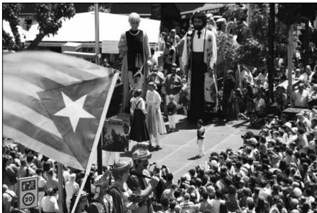
De l'exposició de FFC a la Fira (original en color)

Estem segurs que, como cada any, passarem la Fira de setembre amb bona nota.