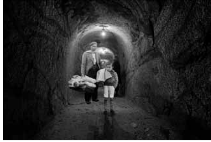
Terçer Premi Joan M. Arenaza (original en color)