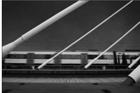
Tercer Premi: Quim Botey