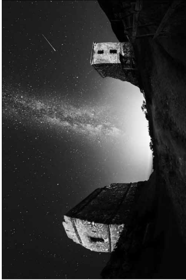
Foto guanyadora XXVè Trofeu Carpinell 2016 autor: Òscar Sánchez (original en color)