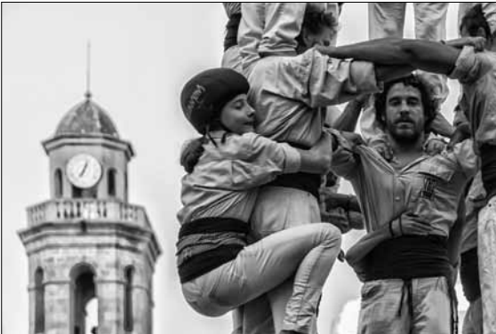
Tercer Premi Trofeu Carpinell autora: Anna Ortega (original en color)