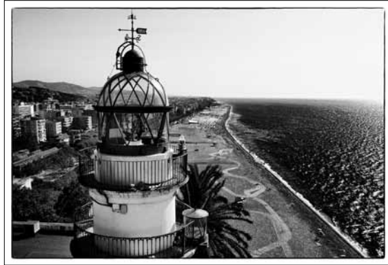
Segon Premi Trofeu Carpinell autor: Joan Serrano