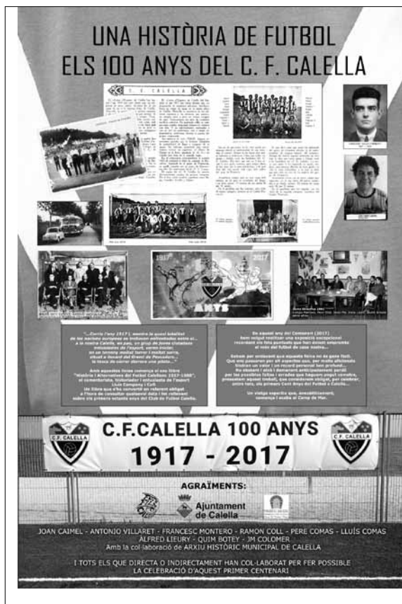
Plafó 150x100 cm