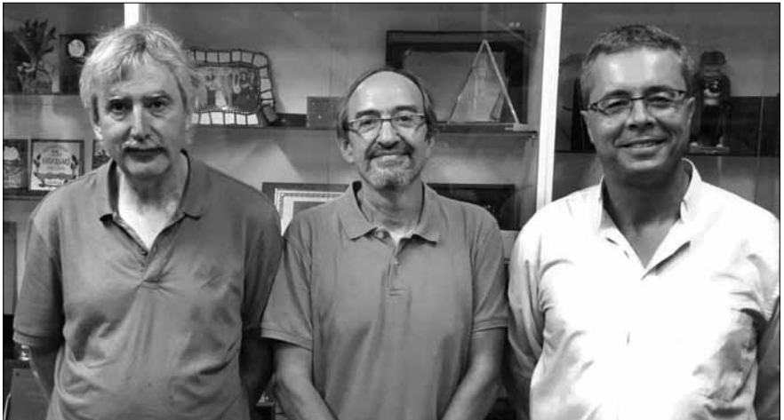
Jurat 26è Trofeu Carpinell